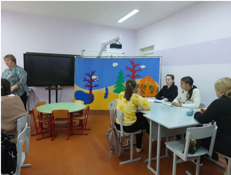
44.02.02 Преподавание в начальных классах,