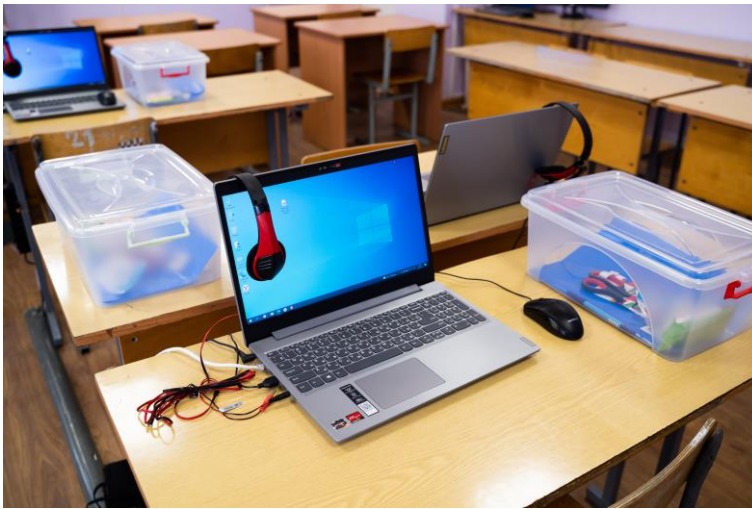
49.02.01 Физическая культура